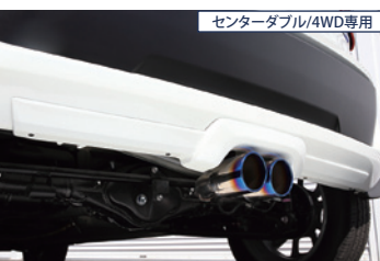
センターダブル/4WD専用

■本体：ステンレス、テール：チタン、ガーニッシュ：FRP ■純正交換(バンパー加工及びガーニッシュの塗装が必要) ■メイン：50.8φ テール：80φ×2 ■性能等確認済表示内容：JQR10162125