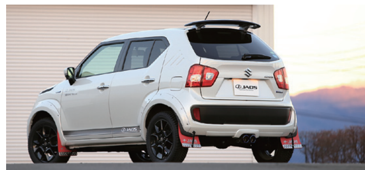
バンパーガーニッシュを付属したチタンテールセンターマフラー BATTLEZマフラー-ZS-CTi