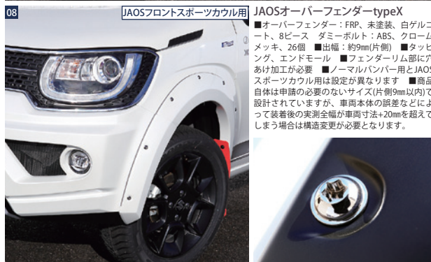
JAOSフロントスポーツカウル用