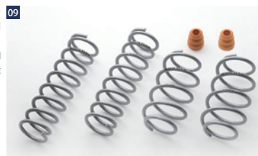
純正位置シングル/4WD専用

2015年、BATTLEZコイルシリーズ最大ともいえるリニューアルを行いました。その軸となるのは保証体制。「ヘタリ」を同製品が販売している限り交換保証するというものです。その名も「Ti-W(Warranty=保証)」。もちろんインゴス用のBATTLEZコイルにも対応されています。保証内容の詳細については、JAOS オフィシャルサイトをご参照ください。