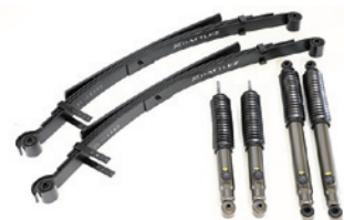
BATTLEZ リフトアップセット今秋リリース予定

株式会社ジャオス TEL.0279-20-5511 FAX.0279-20-5549 www.jaos.co.jp f http://www.facebook.com/JAOSCORPORATION y https://www.youtube.com/user/JAOSCORPORATION + http://minkara.carview.co.jp/userid/839780/blog/ i https://instagram.com/jaos_corporation/ ■各商品は適用車種であっても、グレード・ボディ形状等によって設定が異なる場合があります。ご購入の際はよくご確認ください。 ■掲載されている商品は撮影用の為、実際の商品とは細部において異なる場合があります。 ■商品の仕様及び価格は予告なく変更する場合があります。 ■商品のご購入及び詳細については、もよりの有名自動車用品販売店、4×4ショップまでお問い合わせ下さい。