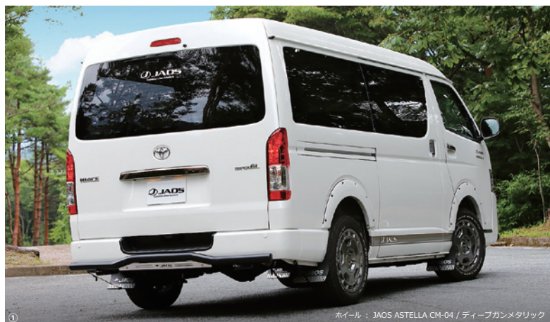
ホイール： JAOS ASTELLA CM-04 / ディープガンメタリック

JAOSのハイエースカスタマイズプロジェクトが新たなフェーズに突入します。その第一弾はホイール。レース用ホイールから引用したサーキュレーションホールと力強い5ディッシュデザインをミックスさせたトランスポーターのための新たなクロスオーバーデザインです。そしてリフトアップサスペンションとスポーツマフラーも現在鋭意開発中。新たなクロスオーバースタイルをもうすぐご覧いただけます。TOYOTA HIACE "JAOS STYLE" 車両と共に我々自身も進化し続けます。